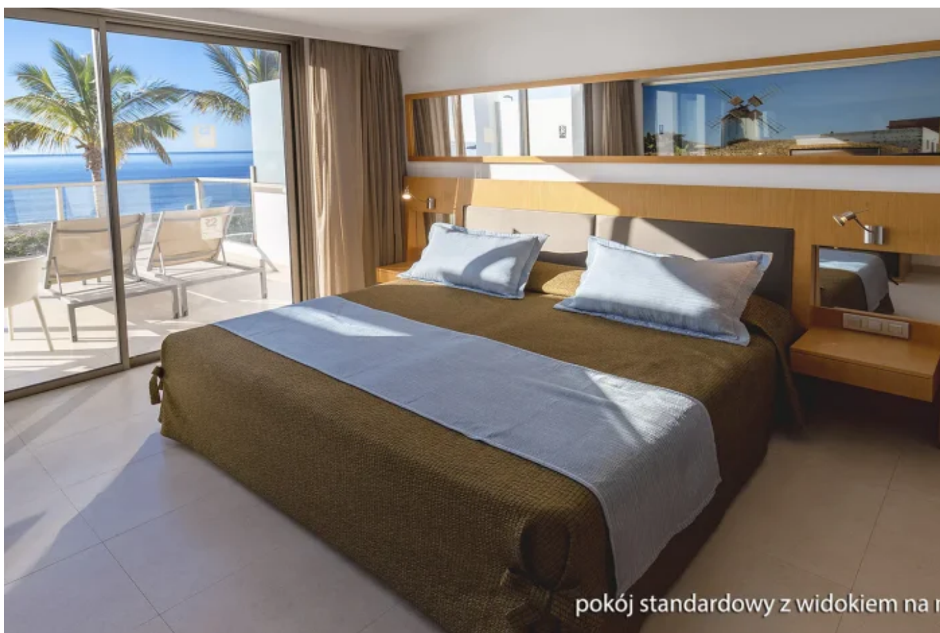
pokój standardowy z widokiem na m