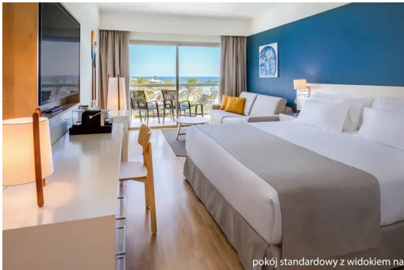
pokój standardowy z widokiem na

Pamiętajcie, że ceny zmieniają się dynamicznie i odpowiadają za nie dostawcy. Są zawsze aktualne w czasie tworzenia artykułu.