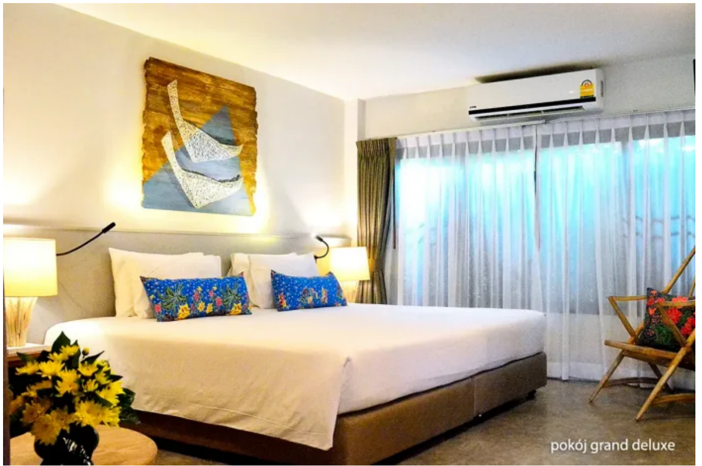
pokój grand deluxe